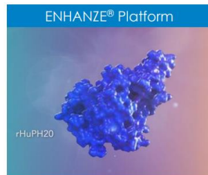
Verwendet proprietäres, Halozyme rHuPH20-Enzym