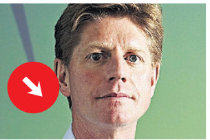
ABB hat massiv weniger Aufträge erhalten. Joe Hogan, Chef des Industriekonzerms, enttäuschte mit einem Gewinneinbruch um ein Drittel im ersten Quartal seine Anleger: Die Aktie verlor diese Woche 5% an Wert.

Höhenflug für OC-Oerlikon-Hauptaktionär Viktor Vekselberg: Die Aktie des Industriekonzerms legte um 26,9 Prozent zu. Spekulanten hatten sich verwettet und nicht mit der erfolgreichen Sanierung gerechnet.